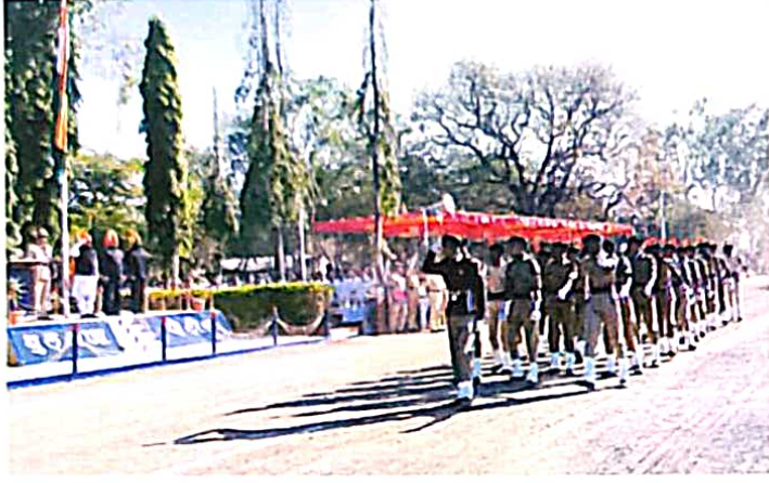
प्रजासत्ताक दिनाच्या निमित्ताने बुलडाणा येथील पोलीस मैदानावर आयोजित परेडमध्ये सहभागी एन.सी.सी. छात्रांचा टुप