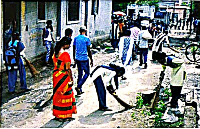
रा.से.यो. दत्तकग्राम- पोखरी येथे स्वच्छता अभियान राबवितांना रा.से.यो. चे स्वयंसवेक-स्वयंसेविका