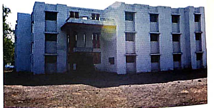
महाविद्यालयाचे मुर्लीचे वसतीगृह