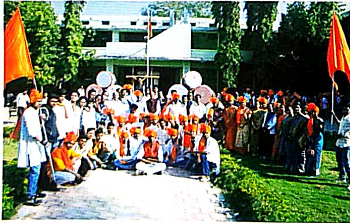
डॉ. पंजाबराव देशमुख जयंती उत्सव रॅलीमध्ये सहभागी विद्यार्थी