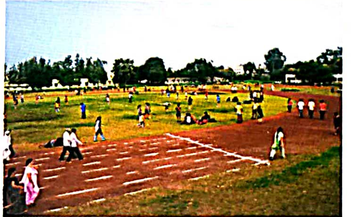
महाविद्यालयाचे प्रशस्त क्रीडांगण