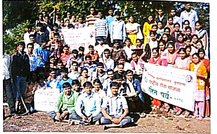
रा.से.यो. श्रमसंस्कार शिविरामध्ये सहभागी स्वयंसेवक-स्वयंसेविका