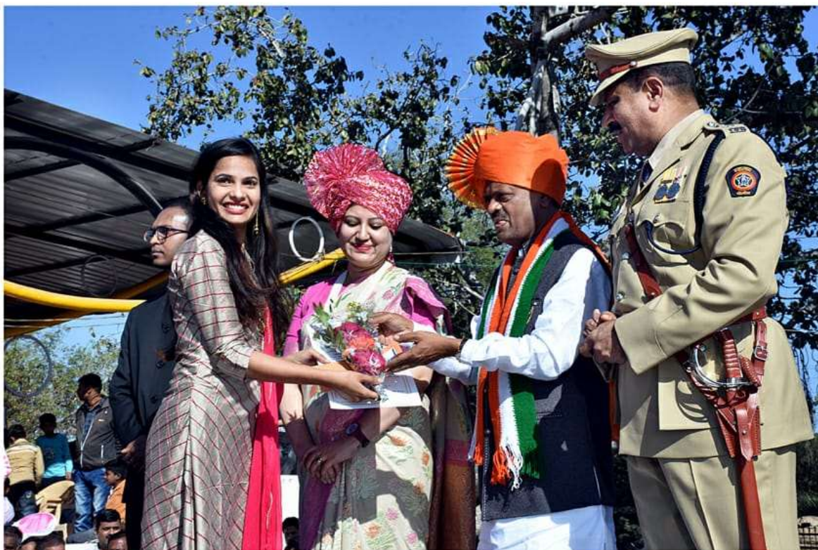
Award Received for “Womens Empowerment” by Guardian Minister of Buldhana District and District Collector Buldhana